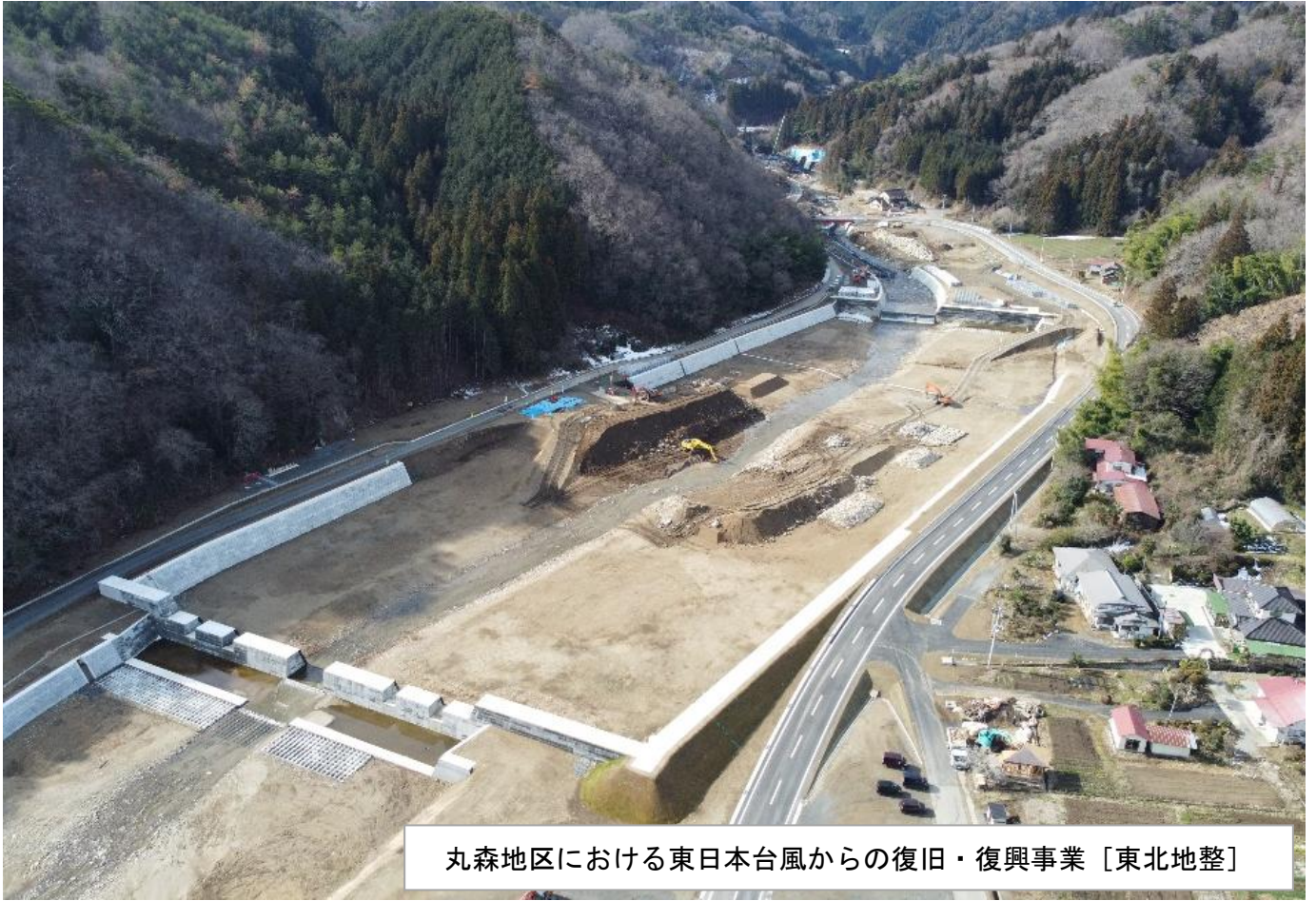
丸森地区における東日本台風からの復旧・復興事業 [東北地整]