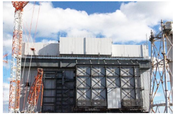
現在の福島第一原子力発電所 1号機

福島第一原子力発電所事故は、2011年3月11日に発生した東日本大震災に伴う巨大津波により、発電所の電源と冷却機能が失われて起きた原子力事故である。津波により非常用電源設備等が浸水し、全交流電源喪失に至ったことで原子炉の冷却機能が失われた結果、1号機から3号機で炉心溶融（メルトダウン）が発生した。さらに水素爆発により原子炉建屋が大きく損傷し、放射性物質が大気中や海洋へ放出された。