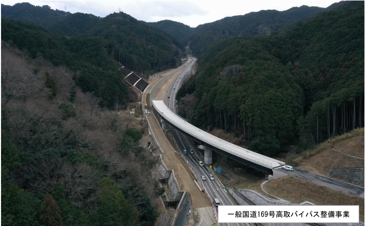
一般国道169号高取バイパス整備事業