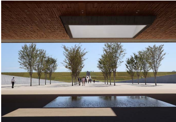
国営追悼・祈念施設 切り通し空間

また、岩手県でも、震災津波の事実と教訓を後世に伝承すること等を目的として、東日本大震災津波伝承館を設置しており、館内では、三陸の津波被害の歴史や、東日本大震災津波の事実、震災から得た教訓などを学ぶことができる映像上映や展示などを見学することができます。