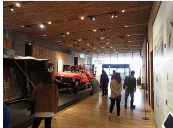
東日本大震災津波伝承館 展示室