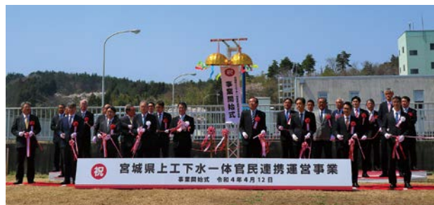
事業開始式（令和4年4月12日 南部山浄水場）

これまで民間事業者の業務は浄水場等の運転管理（仕様発注）に限定されていたが、みやぎ型では契約期間の長期化（20年間）、9事業を一体とした契約、性能発注により、施設の運転、維持管理、改築を効率的に実施するとともに、民間のノウハウやスケールメリットを生かして、大きなコスト削減を達成している。