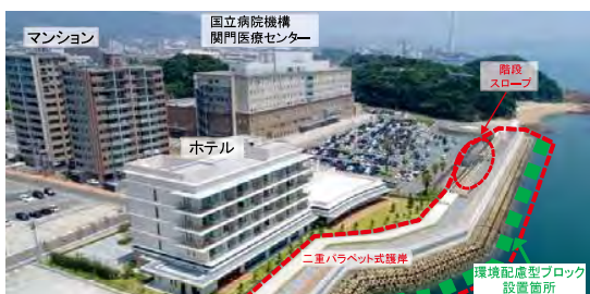
下関港海岸 外浦地区

下関港海岸外浦地区は、関門海峡を望む風光明媚な景観を有し、背後には国立病院機構 関門医療センター、ホテル、商業施設、マンション等が立地し、多くの観光客や地域住民が来訪する地区となっている。しかし、平成11年台風18号、平成24年台風16号等の襲来により、医療センターの駐車場が冠水するなど甚大な被害が発生したことから高潮対策事業として、平成27年6月より防護、景観、環境・水産協調、利用に配慮した護岸の整備に着手した。