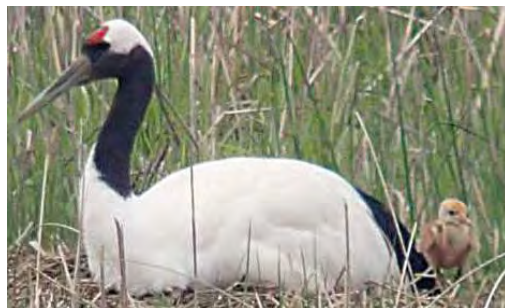
タンチョウの親子（令和3年5月撮影）

取組開始から5年目となる令和2年、目的の一つであるタンチョウの営巣・繁殖が確認された。タンチョウの繁殖は、札幌圏では100年以上ぶりであり、学識者からは遊水地のような人工的な湿地環境での繁殖はおそらく世界初と言われている。今年度もタンチョウのヒナが確認され、2年連続の遊水地内での繁殖に期待が高まっている。