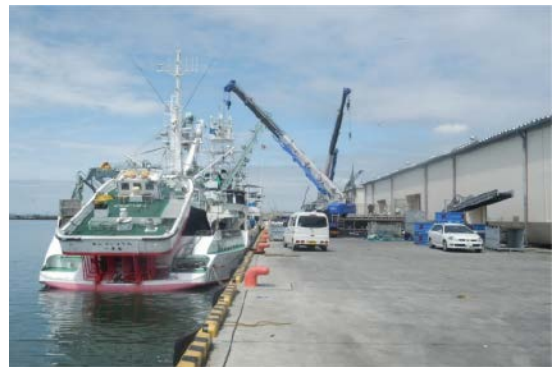
復旧後の状況 石巻漁港（矢板式岸壁）