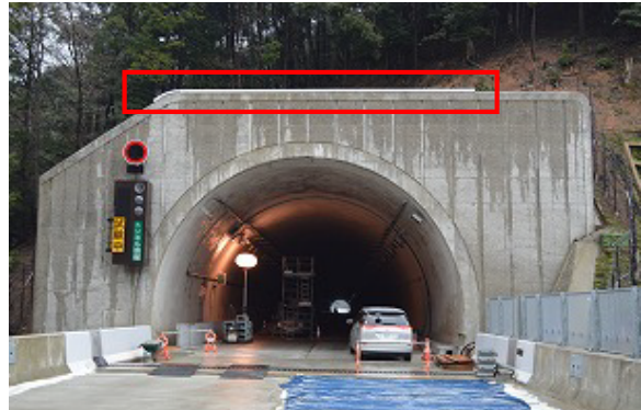
トンネル坑口上部融雪装置設置状況