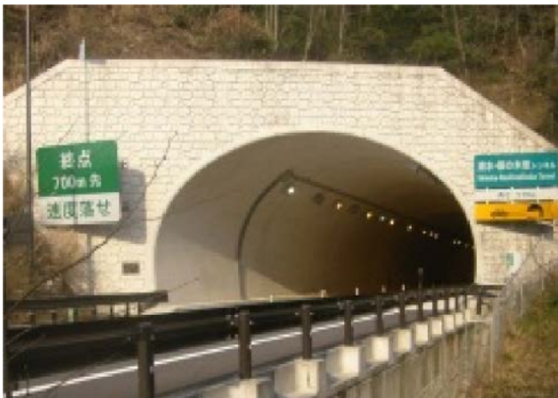
化粧したトンネル壁面

事業名 にま ゆのつ 山陰道「仁摩・温泉津道路」と世界遺産の保全・景観配慮の取り組み 授賞機関 国土交通省中国地方整備局松江国道事務所 実施期間 平成16年4月1日～平成27年3月14日