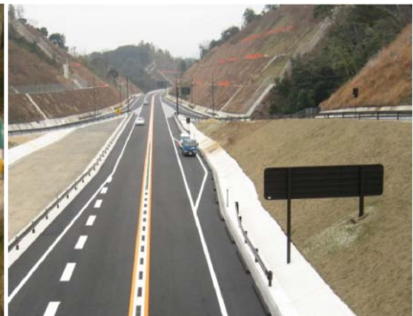
↑温泉津IC付近 景観に配慮し、道路付属物に景観色を採用。