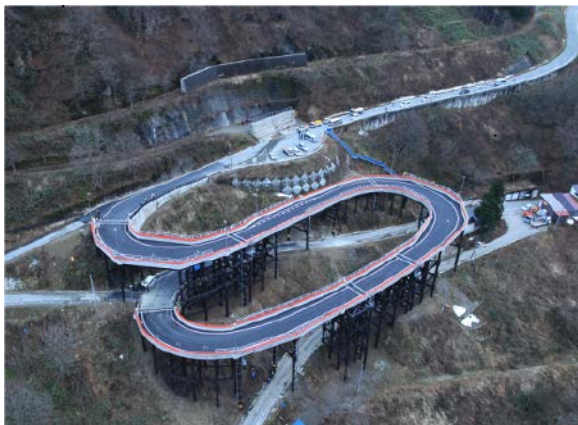
肘折希望大橋 全景

事業名 主要地方道戸沢大蔵線 ひじおりのぞみおおはし (肘折希望大橋) 道路災害復旧事業 授賞機関 山形県最上総合支庁 実施期間 平成24年7月21日～平成25年12月16日