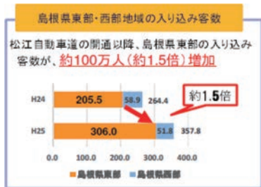
島根県東部・西部地域の入り込み客数

事業名 「松江自動車道」と「道の駅・パーキング」の整備による地域活性化の取り組み 授賞機関 国土交通省中国地方整備局松江国道事務所 国土交通省中国地方整備局三次河川国道事務所 島根県、広島県、雲南市、庄原市、三次市 西日本高速道路株式会社松江高速道路事務所 西日本高速道路株式会社三次高速道路事務所 実施期間 平成5年11月19日～平成25年3月30日