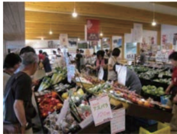
農産物直売所の賑わい