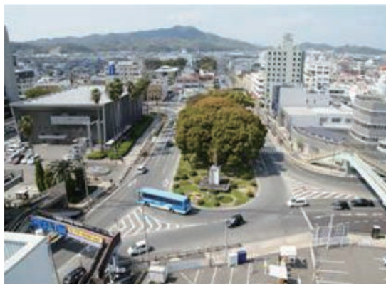
事業着手前（ロータリー形式）

事業名 国道317号 今治市役所前ロータリー交差点改良事業 授賞機関 愛媛県東予地方局今治土木事務所 実施期間 平成21年4月1日～平成23年11月