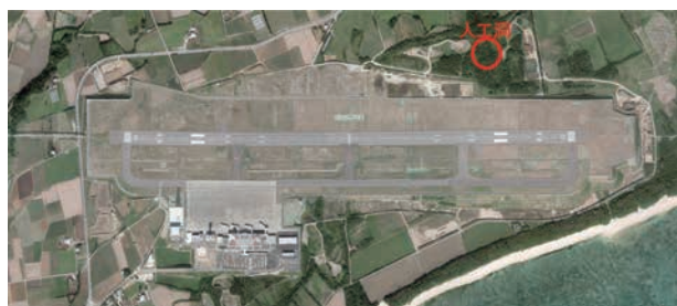
空港施設全体(撮影：H25.2.4)

事業名 新石垣空港整備事業 授賞機関 沖縄県土木建築部新石垣空港建設事務所 実施期間 平成17年度～平成24年度