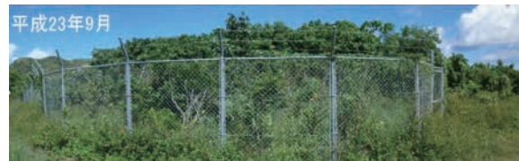
小型コウモリ類保全対策(人工洞)