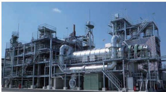
下水汚泥燃料化施設全景写真 手前筒状のものが炭化炉キルン

事業名 衣浦東部流域下水道下水汚泥燃料化事業 授賞機関 愛知県知立建設事務所 実施期間 平成21年12月17日～平成24年3月27日