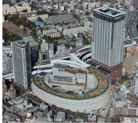
上空から見た目黒天空庭園