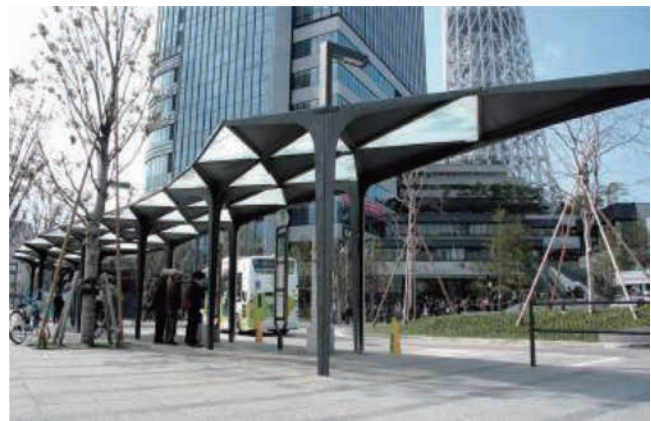
江戸切子をモチーフとしたシェルター