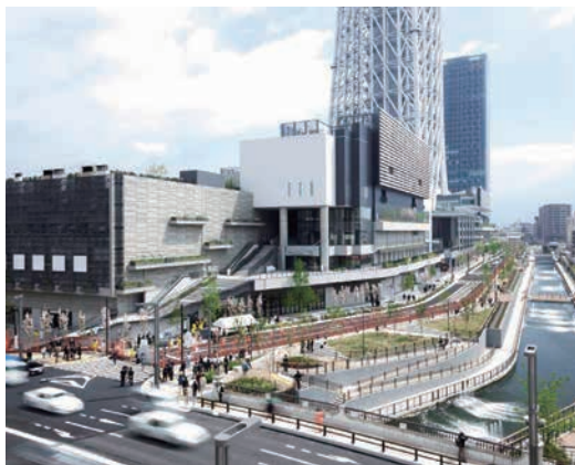
街区・道路・河川

事業名 押上・業平橋駅周辺土地区画整理事業における公共施設整備 授賞機関 独立行政法人都市再生機構東日本都市再生本部 実施期間 平成20年8月1日～平成24年3月9日