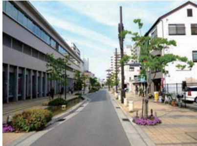
まちづくり提案による公共施設整備 (せせらぎのあるコミュニティ道路)