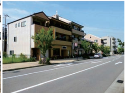
景観形成市民協定によるまちなみ