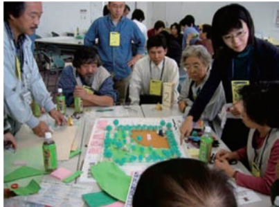
まちづくり協議会 (ワークショップの様子)

事業名 神戸国際港都建設事業 新長田駅北地区震災復興土地地区画整理事業 受賞機関 神戸市都市計画総局市街地整備部 実施期間 平成8年7月9日～平成23年3月28日