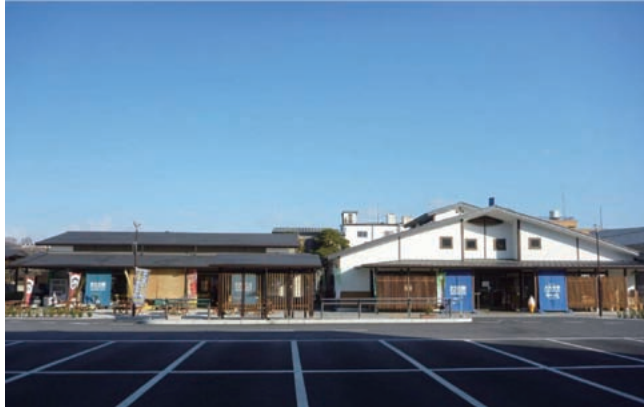
左より「物産館棟」「本館棟」