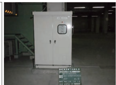
一酸化二窒素連続測定計器