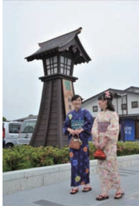
まちの駅『新・鹿沼宿』

事業名 都市再生整備計画事業 中心市街地新拠点周辺地区まちの駅新・鹿沼宿整備事業 受賞機関 鹿沼市 実施期間 平成22年7月14日～平成23年7月10日