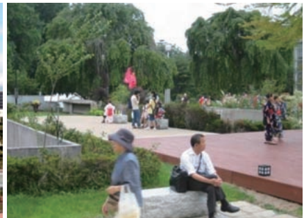
緑のオアシスとして機能