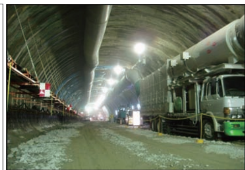
大型集塵機による粉じんの低減