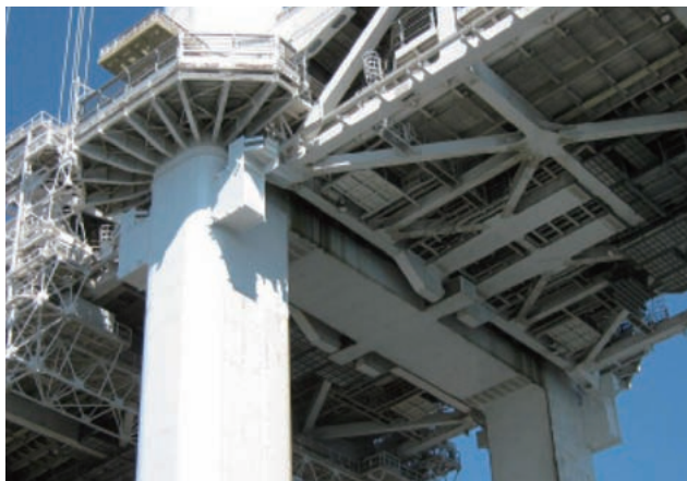
レインボブリッジのウイングタンク補強

事業名 横浜ベイブリッジ・レインボブリッジ・鶴見つばさ橋耐震性向上事業 受賞機関 首都高速道路株式会社 実施期間 平成17年6月～平成22年3月