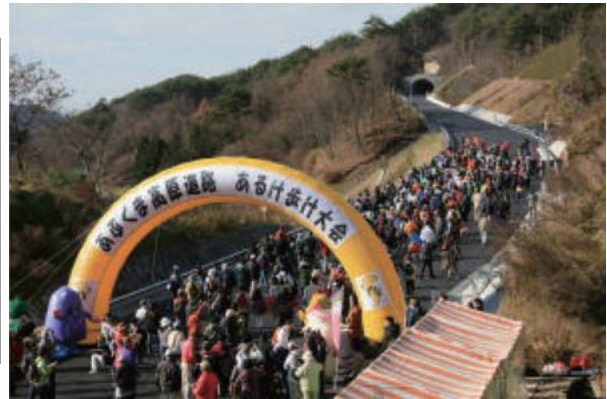
あぶくま高原道路あるけ歩け大会FINAL(H22.11.27)の様子