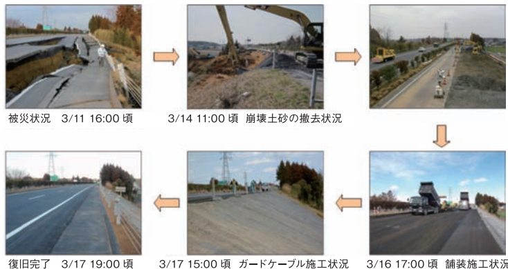
被災状況 3/11 16:00頃 3/14 11:00頃 崩壊土砂の撤去状況 3/16 17:00頃 舗装施工状況 3/17 15:00頃 ガードケーブル施工状況 3/17 19:00頃 復旧完了 常磐道（上り線水戸IC～那珂IC）復旧状況写真

事業名 東日本大震災における高速道路災害応急復旧事業 受賞機関 東日本高速道路株式会社東北支社 他9管理事務所 東日本高速道路株式会社関東支社 他7管理事務所 実施期間 平成23年3月11日～平成23年3月24日