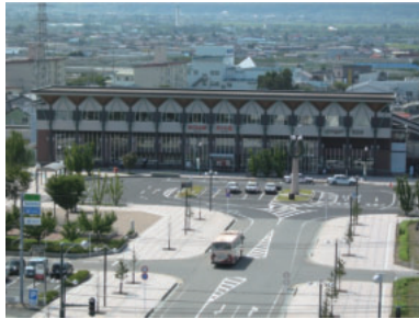
JRさくらんぼ東根駅

事業名 東根都市計画事業 一本木土地区画整理事業 受賞機関 東根市 実施期間 平成5年11月15日～平成21年3月31日