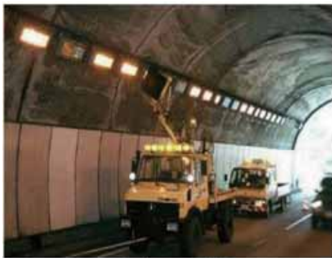
従来の回転ブラシ式清掃 1～2 km/h

事業名 キャピテーション噴流技術を用いたトンネル照明器具の高速清掃装置の開発 受賞機関 (株)高速道路総合技術研究所 施設研究部施設研究室 実施期間 平成16年5月31日～平成19年10月24日