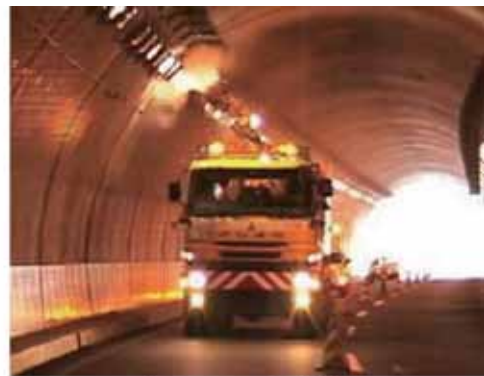
キャピテーション高速清掃 50km/h