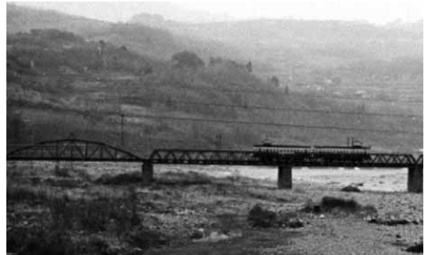
鉄道橋時代(左端一連を今回利用)