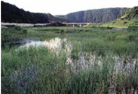
ウェットランド沼沢地

事業名 はいづか 灰塚ダム建設事業 受賞機関 国土交通省中国地方整備局 三次河川国道事務所 実施期間 昭和63年4月1日～平成19年3月31日