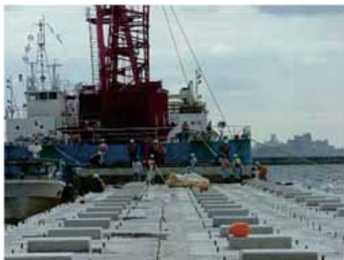
海象条件を確認しケーソンを連続据付