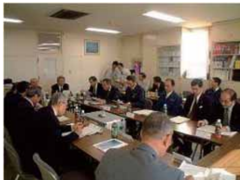
函館港島防波堤災害復旧事業推進協議会