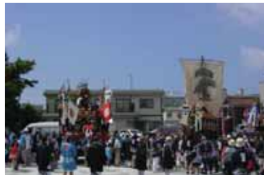
盛大に執り行われる「姥神大神宮渡御祭」