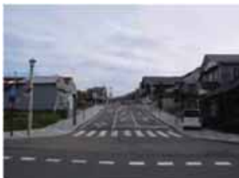
建物の修景とともに電線類地中化を行った街路