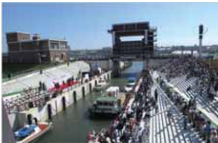
完成記念式典の様子