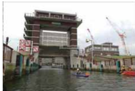
カヌーなどの平常時の利用も可能