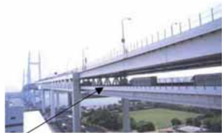
横浜ベイブリッジ一般部（国道357号）【平成16年4月24日供用】