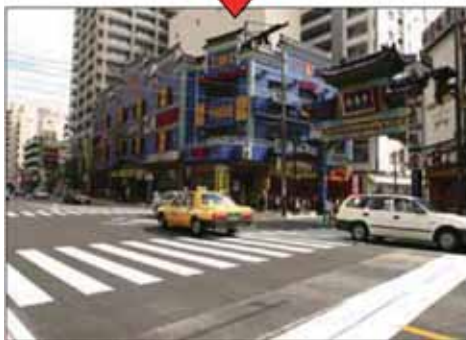
ベイブリッジ整備前後の様子