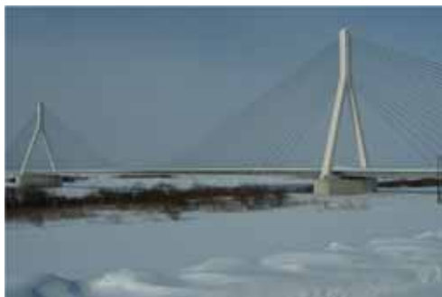
美原大橋完成写真