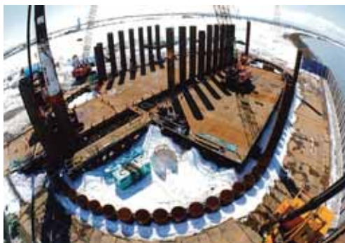
P1 橋脚鋼管矢板打設状況