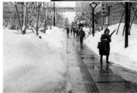
冬期における歩行者空間