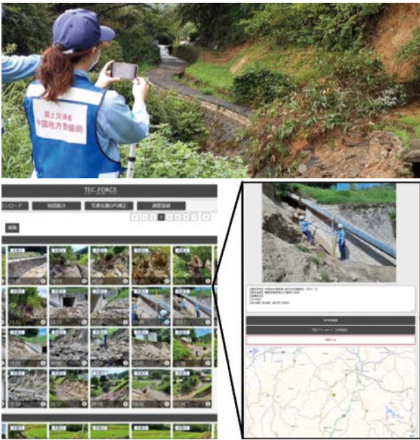
写真-9 現地調査を効率化するTECアプリの試行 ど、各地で活動を行った。