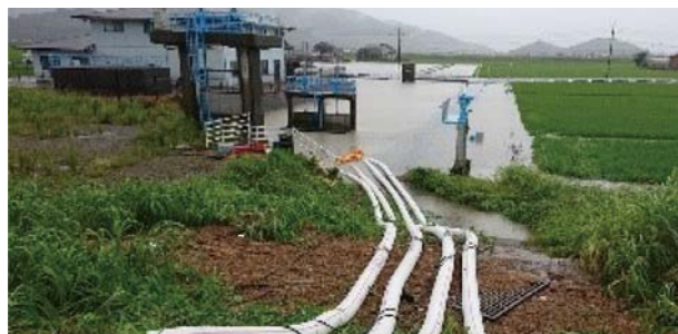
写真-7 排水ポンプ車による浸水排除（佐賀県大町町）