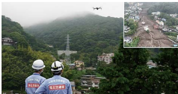
写真-4 ドローンによる被災状況調査（静岡県熱海市）

7月の大雨において、国土交通省では、中部、中国、九州地方の14県20市町村に対し、リエゾンや被災状況調査班等、のべ1千人を超えるTEC-FORCEを派遣した。特に、大規模な土石流が発生した静岡県熱海市では、ドローンによる被災状