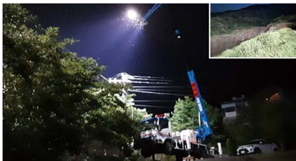
写真-5 照明車により24時間で不安定土砂を監視（静岡県熱海市）

況調査を行うとともに、溪流の最上流部等への監視カメラ設置による監視体制強化を支援し、警察・消防・自衛隊が進める救助活動の側方支援に取り組んだ。また、土砂災害や浸水被害が多発した島根県雲南市、飯南町では、一日あたり最大44名の体制で約350箇所の被災状況調査を実施した。