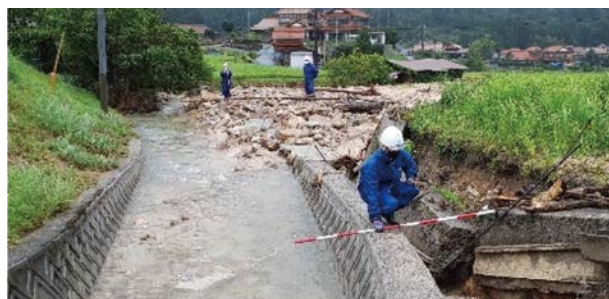
写真-8 河川の被災状況調査（広島県北広島町）