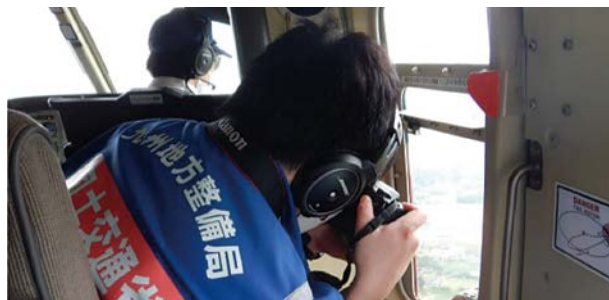
写真-6 防災ヘリコプターによる広域被災状況調査（九州地方整備局管内）

また、8月の大雨において、国土交通省では、関東、北陸、中部、中国、四国、九州の20県27市町に対し、のべ600人を超えるTEC-FORCEを派遣し、排水ポンプ車による緊急排水活動や防災ヘリコプターによる広域的な被災状況調査等を実施した。令和元年8月に続いて浸水被害が発生した国管理の六角川では、排水ポンプ車12台体制で浸水排除を行ったほか、ドローンや防災ヘリコプターによる浸水範囲の調査等を実施した。大雨特別警報が発表され浸水被害や土砂災害が多発した広島県北広島町では、一日あたり最大で24名の体制で約130箇所の被災状況調査を実施するな