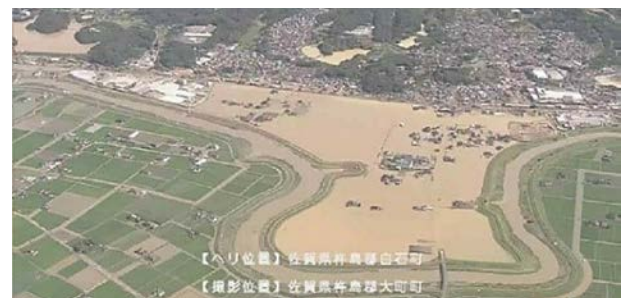
写真-3 六角川水系六角川の浸水（佐賀県武雄市）

また鉄道についても中部、中国、九州において、橋梁の損壊や土砂流入などの施設被害が発生した。