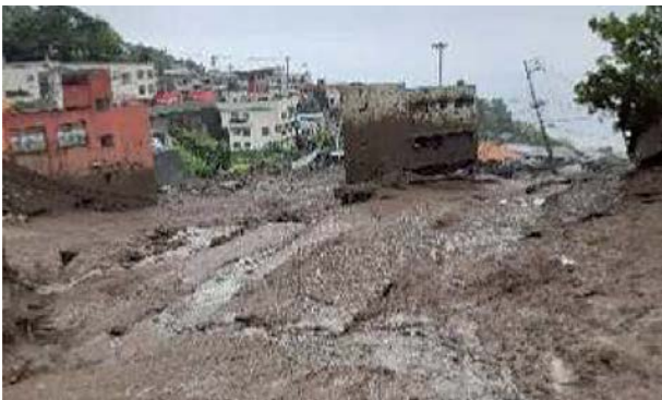
写真-2 土石流による被害（静岡県熱海市）

静岡県熱海市の逢初川では、上流部標高約390m地点で発生した崩壊により、3日に土石流が発生し、甚大な被害をもたらした。土石流の一部は既設砂防堰堤で捕捉されたが、大部分は堰堤を乗り越え、住居等を巻き込みながら流下し、新幹線・国道等を超え、伊豆山港にまで到達した。この土石流により死者26名、行方不明者2名、負傷者30名の人的被害が生じたほか、周辺の道路、鉄道、港湾、上下水道、ガスといった社会基盤に大きな被害が発生した。