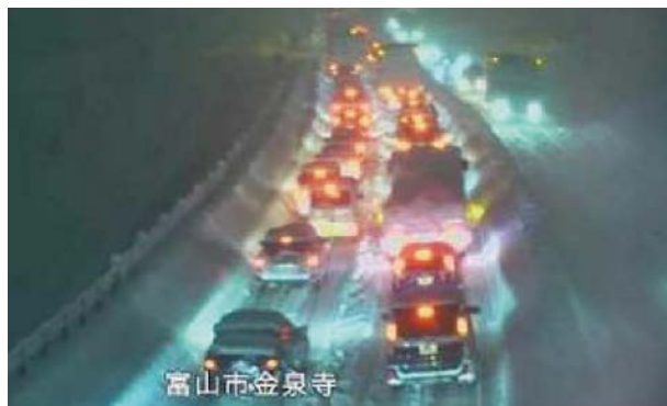
写真-1 国道8号 車両滞留(富山県富山市)