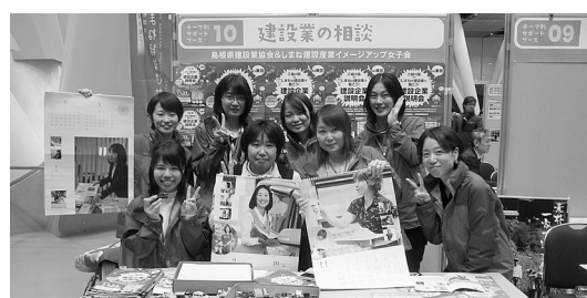
完成したカレンダーを記念して

今年度は「親子でDIY講座」を開催し、小学生に物づくりの楽しさを体験してもらう活動なども実施している。これらの活動を通じて、県内の建設業で働く女性、県外で同じような活動をする女子会とも交流することができた。