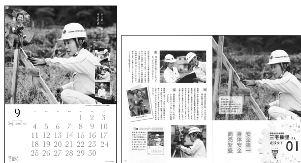
カレンダー 女子図鑑

カレンダーを制作する中でメンバーから“なぜモデルが建設業で働くようになったか知りたい！”という話がでて、カレンダーモデルに働くようになったきっかけや、建設業の魅力についてインタビューし、それを冊子にしようという事になり、『しまね建設女子図鑑』を制作した。図鑑はUIターンフェアや出前講座、お祭りなど女子会が参加するイベントで配布し、好評をいただいた。