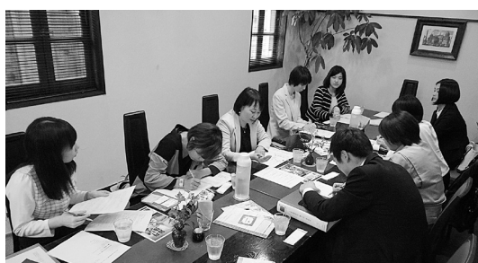
カフェでのミーティングの様子

現在の女子会は島根県内の建設業界で働く女性（民間、行政、学生）約25名で活動している。