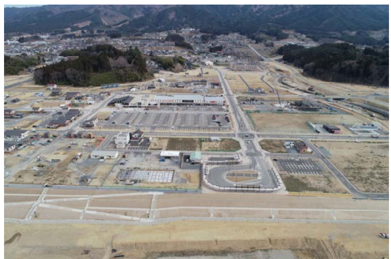
陸前高田市被災市街地復興土地区画整理事業

施行面積は、高田地区が約186ha、今泉地区は約112haと被災地最大規模であり、全長3kmに及ぶベルトコンベアを使用した土砂搬出により工事期間の短縮を図りました。平成32年度の事業完成を目指しています。平成30年9月に、高田地区のかさ上げ地で交通の結節点となる交通広場が完成し、まちの賑わいも少しずつ戻ってきています。