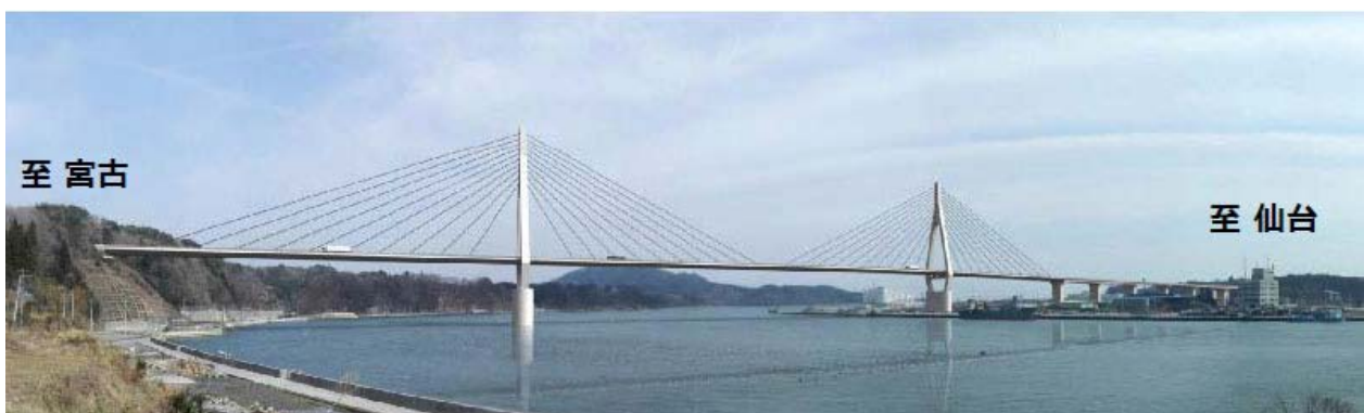
「（仮称）気仙沼湾横断橋」完成イメージ