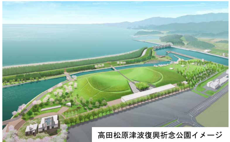
高田松原津波復興祈念公園イメージ

また、公園としては、2020年に「国営追悼・祈念施設（仮称）」及びその周辺の一部区域を供用開始し、その後、順次、残りの区域を供用していく予定です。