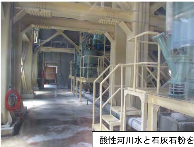
酸性河川水と石灰石粉を中和工場では混合し湯川に投入

品木ダム水質管理所の中和工場は酸性の河川水と石灰石粉を混合し、河川に投入しています。