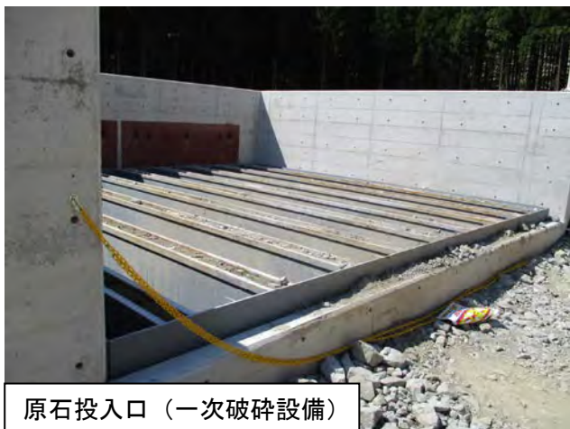
原石投入口（一次破碎設備）

この骨材は、骨材プラントからダムサイトまでの約10kmをベルトコンベアで運搬されます。