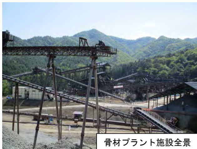
骨材プラント施設全景