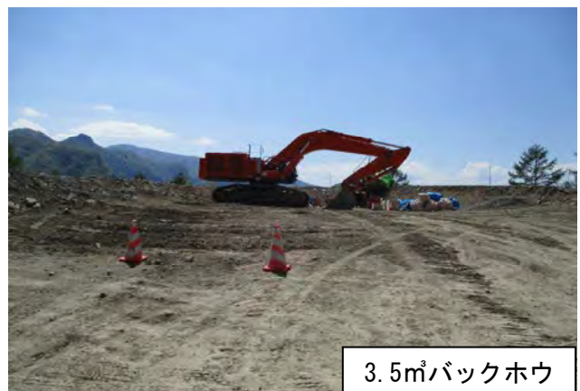
3.5m 3 バックホウ