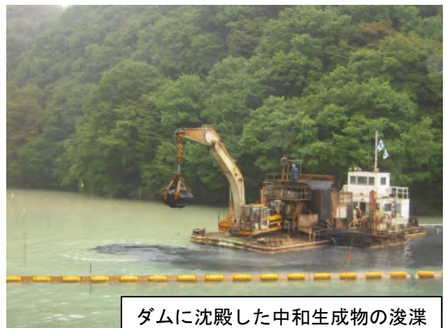
ダムに沈殿した中和生成物の浚渫