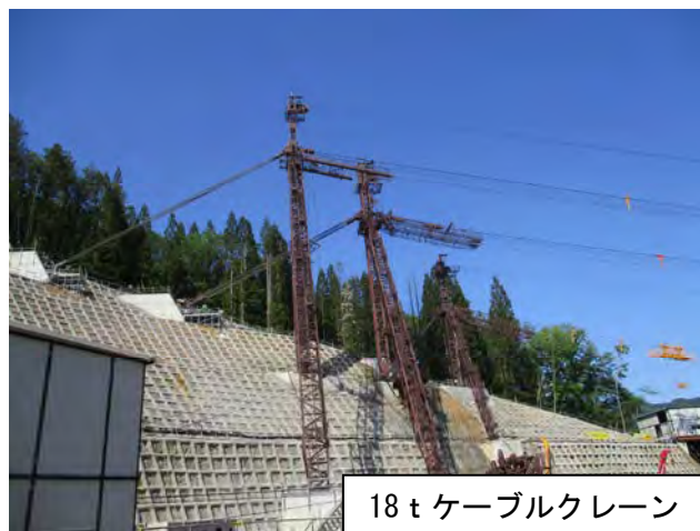
18tケーブルクレーン