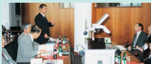
ヨーロッパ公共施設調査団 〔アウトバーン〕の計画・建設・維持管理