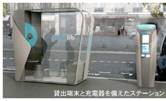
貸出端末と充電器を備えたステーション

今秋より運用が始まったセルフサービス型EVレンタカー「オートリブ」を視察します。(パリ市内)