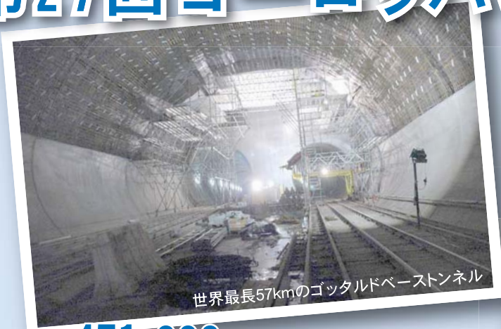
世界最長57kmのゴットルドベーストンネル

調査テーマは「アウトバンの維持管理と資金調達、世界最長トンネルの施工技術」を取り上げ、ドイツ（ドイツ連邦運輸建設省（BMVBS）ボン市）、スイス（アルプトランジットゴットルド（ATG社）ゴットルド峠）を訪問し調査を行います。