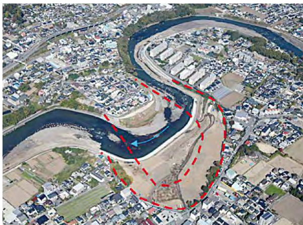
【白川】龍田陣内・下南部地区の河道付替え

この災害に対し、白川水系白川及び黒川は河川激甚災害対策特別緊急事業として採択され、白川9.4km、黒川27.0km間において再度災害防止を目的に河道付替、掘削、築堤、遊水地、輪中堤及び宅地嵩上げ等、上下流一体となった治水対策を実施した。