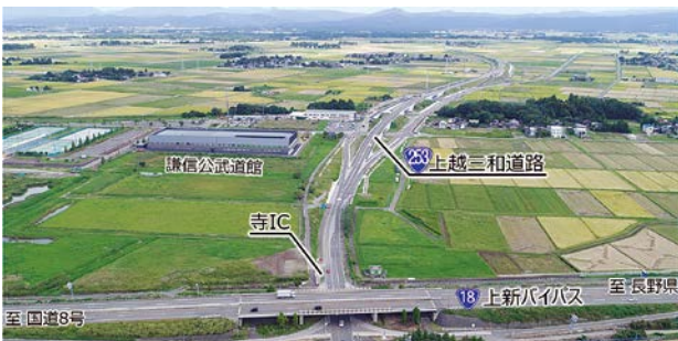
部分開通した上越三和道路(上越市から魚沼地方を望む)

上越三和道路は、全線にわたり、厚さ約60mの軟弱地盤上に高盛土構造(高さ7～10m)のアクセスコントロールされた道路である。橋梁部を除く盛土区間全線