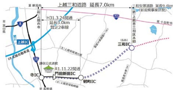
上越三和道路 位置図

今回、寺IC～鶴町IC間の延長3.0kmについて、当地域における厚さ約60mにもおよぶ軟弱地盤対策工の最適化を図り、平成31年3月24日に部分開通したものである(門田新田ICは令和元年11月22日に開通)。