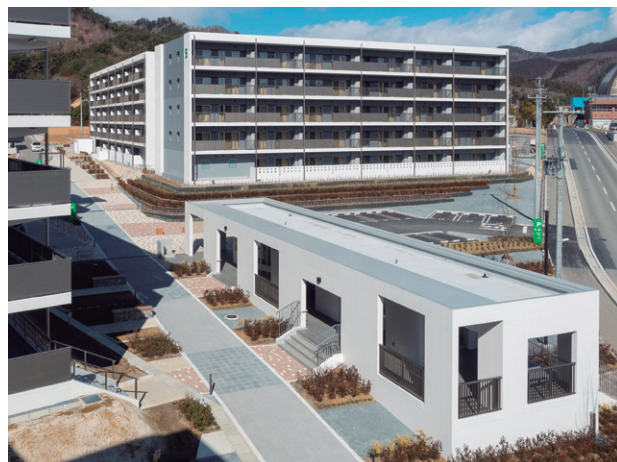
眺望軸に寄り添うコミュニティボックス

また、この眺望軸上を地域住民のコミュニティ形成の場とするため、コミュニティボックス（談話室）・広場・ベンチ・共同花壇などを配置し、地域の活性化を促進する住民交流・地域交流の空間を創出した。