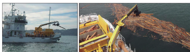
大量に漂流する流木の回収

平成28年台風16号により鹿児島湾に流出していた流木が、高速船やフェリーの安全な航行に支障を及ぼしていたことから、熊本港湾・空港整備事務所に配備されている直轄調査観測兼清掃船「海煌」が管轄外である鹿児島湾の流木回収を行った取組み。地元の漁業者との連携を図るなどして、大量の流木の迅速な回収を行い、鹿児島湾の早期の安全航行環境が確保できた点が高く評価された。