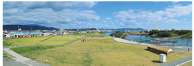
「大貫かわまち交流広場」の全景

延岡市の観光拠点である大貫地区周辺で、大瀬川の河道掘削に合わせて水辺の環境整備を行った事業。その土地特有の歴史ある「鮎やな」を中心に据え、地元住民・関係機関と議論を重ねてプランを作った結果、延岡市を代表する憩いの場・観光スポットに育ちつつある点や、各施設の利用者数もしっかりカウントされ、またそのいずれも増加傾向を示しており、成果が分かりやすく示されていることを評価。