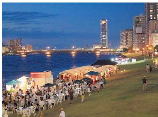
ミズベリング信濃川やすらぎ堤の状況

「やすらぎ堤」は政令指定都市「新潟」の中心市街地を流れる信濃川の治水を目的に整備された緩傾斜堤防であると同時に、豊かな水辺空間として多くの市民から利用されてきた。そして平成26年からはこの「やすらぎ堤」を活用してさらなる賑わいを生み出そうと、市民を中心とした多様なメンバーが結束し「ミズベリング信濃川やすらぎ堤」プロジェクトに取り組んでいる。平成28年2月には、万代橋と八千代橋の区間が北陸の直轄管理河川で初の「都市・地域再生等利用区域」に指定され、同年7～9月に民間事業者による「オープンカフェ」や「BBQ」等を提供する飲食店が出店し、約3万人の方々に利用されるなど大きな成果を上げた。