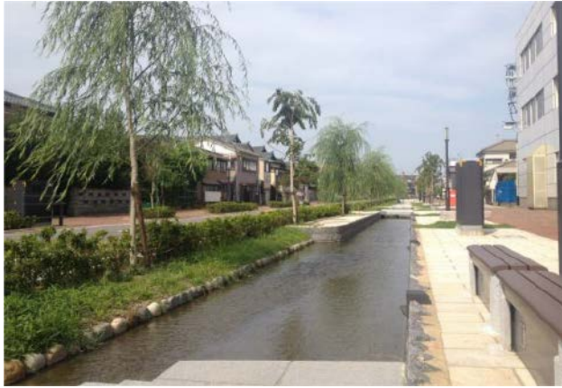
かつての堀割をイメージした水路を新設

事業名 はやかわほりどお 早川堀通り水と緑のみちづくり推進事業 授賞機関 新潟市東部地域土木事務所建設課 実施期間 平成18年6月11日～平成26年3月24日