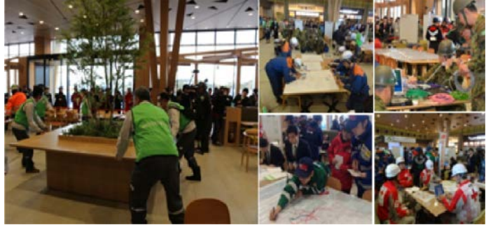
防災拠点室内運営訓練（H26.3.14）