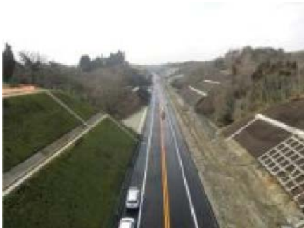
大規模な切土区間

事業名 のうえつ 能越自動車道 ななおひみ 七尾氷見道路（国道470号） 授賞機関 国土交通省北陸地方整備局富山河川国道事務所 国土交通省北陸地方整備局金沢河川国道事務所 実施期間 平成8年度～平成27年2月28日