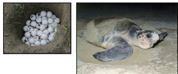
ウミガメが産卵できる砂浜を整備