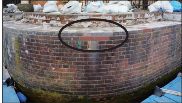
施工状況（経年劣化による煉瓦部の補修） 配列は既設の復旧、新材は製作品