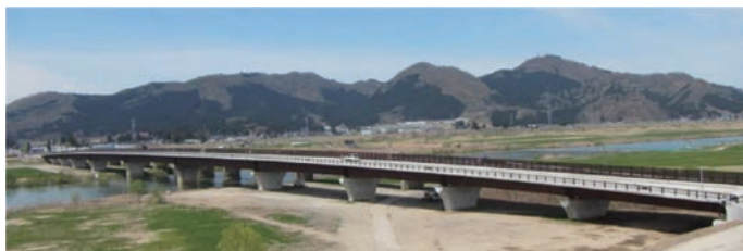
大曲花火大橋（上流側から）

事業名 「大曲花火大橋」建設事業 授賞機関 秋田県 実施期間 平成16年4月1日～平成25年8月11日