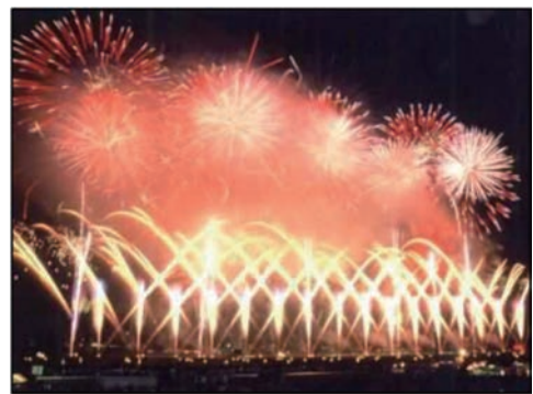
日本一の大曲花火競技会