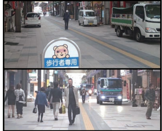
荷捌車は、通行・荷捌ともに道路端で行い、以前のような錯綜は見られなくなった