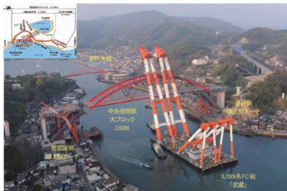
大ブロッカー一括架設状況

事業名 一般国道487号橋梁整備事業 第二音戸大橋 授賞機関 広島県西部建設事務所呉支所 実施期間 平成7年4月1日～平成24年12月28日