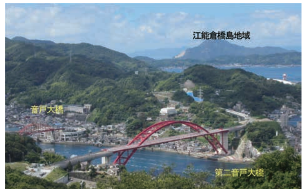
音戸ノ瀬戸に並ぶ「音戸大橋」と「第二音戸大橋」