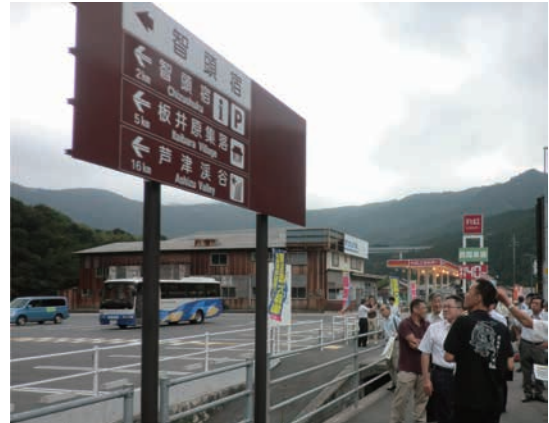
分岐点(交差点部)に設置した観光地案内標識 主要な観光地名とピクトマーク、距離などを表示