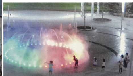
親水広場(通常時・夜間)