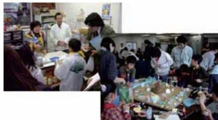
ワークショップでの取り組み

事業名 子どものアイデアを活かした第1号公園～鮫洲運動公園改修整備～ 受賞機関 東京都品川区 実施期間 平成22年9月30日～平成23年3月15日