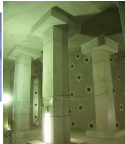
耐震補強後の配水池内状況(2)