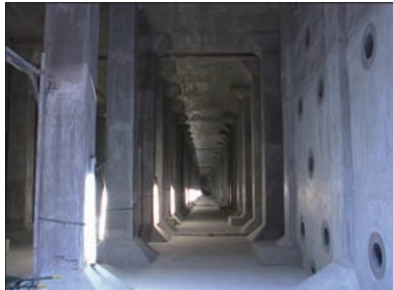
耐震補強後の配水池内状況(1) 右側の壁は、既設の耐震壁の整流孔をプラスチック製の型枠を用い、無収縮モルタルを充填して封じ込めた。