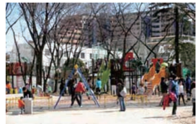
リニューアルオープン後利用状況