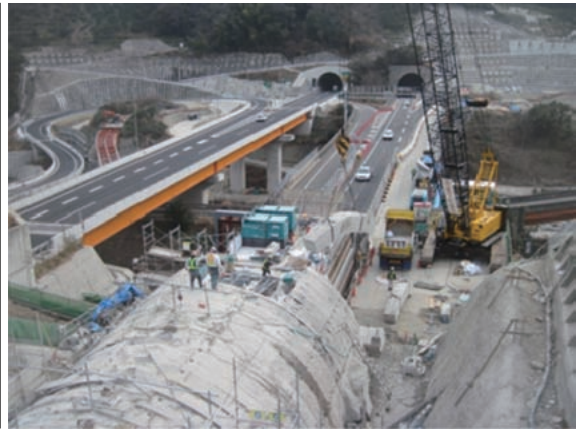
藤白トンネル覆工撤去状況