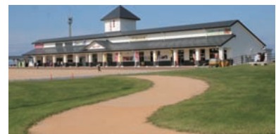
山陰道「琴浦パーキング」に隣接して、琴浦町が整備した「物産館ことうら」