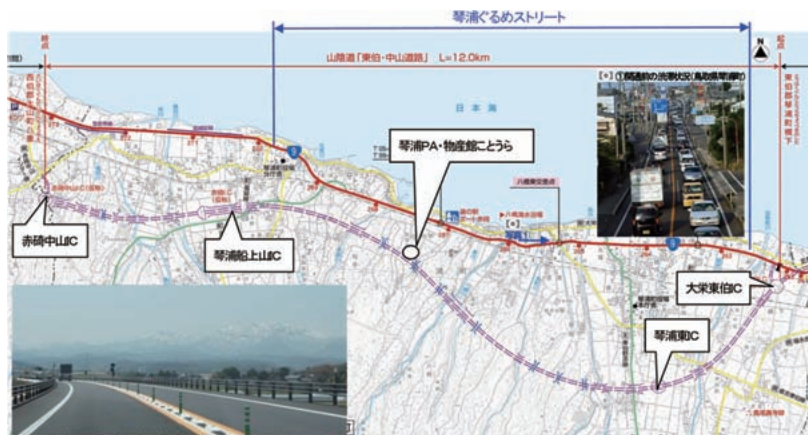
東伯・中山道路ルート図

事業名 一般国道9号東伯・中山道路～地域と一体となったみちづくり～ 受賞機関 国土交通省中国地方整備局倉吉河川国道事務所 鳥取県琴浦町 実施期間 平成11年4月1日～平成23年2月27日